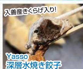
入善産きくらげ入り! Yasso 深層水焼き餃子