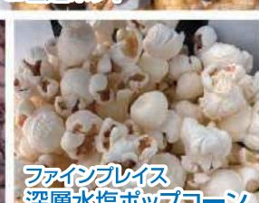
ファインブレイズ 深層水塩ポップコーン