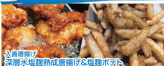
入善唐揚げ 深層水塩麹熟成唐揚げ&塩麹ポテト