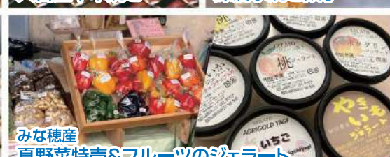
みな穂産 夏野菜特売&フルーツのジェラート