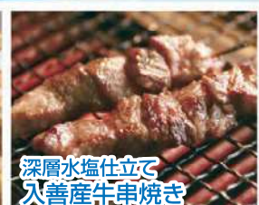
深層水塩仕立て 入善産牛串焼き